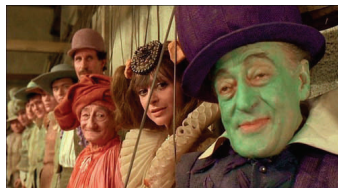
Fotograma de Che cose sono le nuvole

Créditos: la asistencia completa a las jornadas se convalidará por 1 crédito de libre elección. Se expedirá certificado.