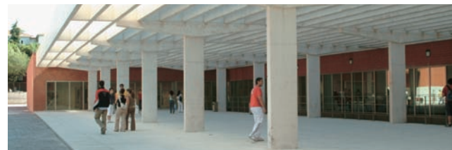
(1s): Primer semestre. (2s): Segundo semestre.