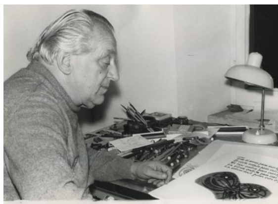
El escritor español Rafael Alberti contemplando el grabado: "Los ojos de Picasso".