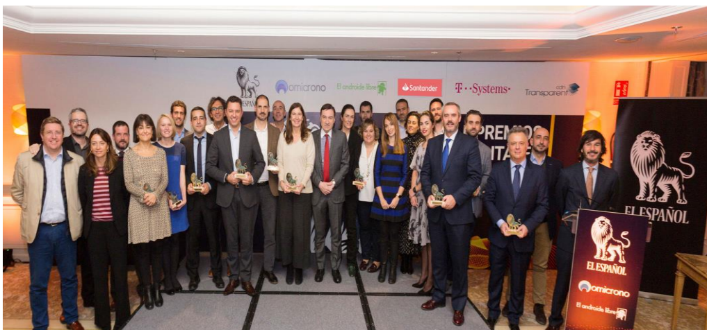
Foto de familia de los miembros del Jurado junto a los premiados de la Categoría de Innovación en los II Premios Digitales de EL ESPAÑOL