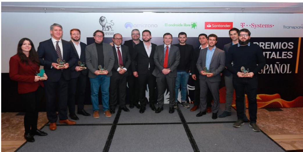
Foto de familia de los premiados en la categoría de Tecnología en los II Premios Digitales de EL ESPAÑOL