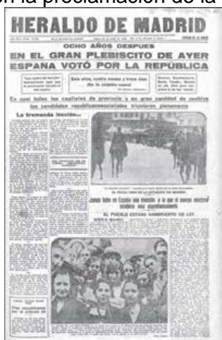
Periódico "Heraldo de Madrid" de abril de 1931.

Comente la imagen y su relación con la proclamación de la Segunda República.