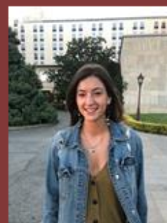
ANA SELLERS COMUNICACIÓN