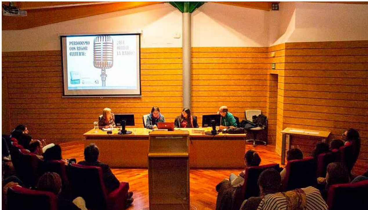
Las II Jornadas de Periodismo Cultural, dedicadas a la radio

El objetivo de estas jornadas era ofrecer a los estudiantes de la Facultad de Ciencias de la Comunicación una visión global de la propuesta radiofónica actual sobre la programación dedicada a todos los ámbitos culturales, además de plantear el futuro que le depara a este tipo de espacios en las emisoras españolas, ya sean de titularidad pública, privada o las denominadas del Tercer Sector o comunitarias.