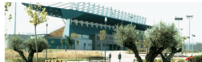
(1s): Primer semestre. (2s): Segundo semestre.