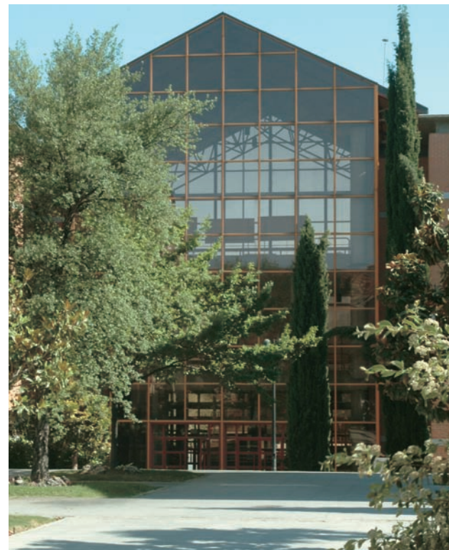
(*) De la relación de Asignaturas Optativas, la Universidad ofertará anualmente las que esté en disposición de impartir.