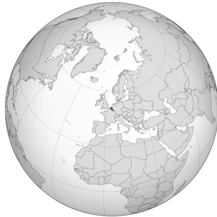
Resto del mundo